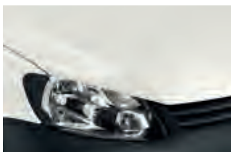
Candy White однотонна фарба B4B4

Аби Ваш Volkswagen було якнайкраще захищено від механічного та хімічного впливу, кузов спочатку оцинковується гальванічним способом. Тільки після цього ми наносимо кілька шарів фарби та дозволяємо їм затвердіти. В результаті отримуємо стійку до подряпин, міцну поверхню. Це дозволяє автомобілю виглядати як новий, навіть за найсуворіших умов.