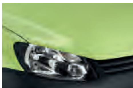
Primavera Green 1) однотонна фарба E0E0