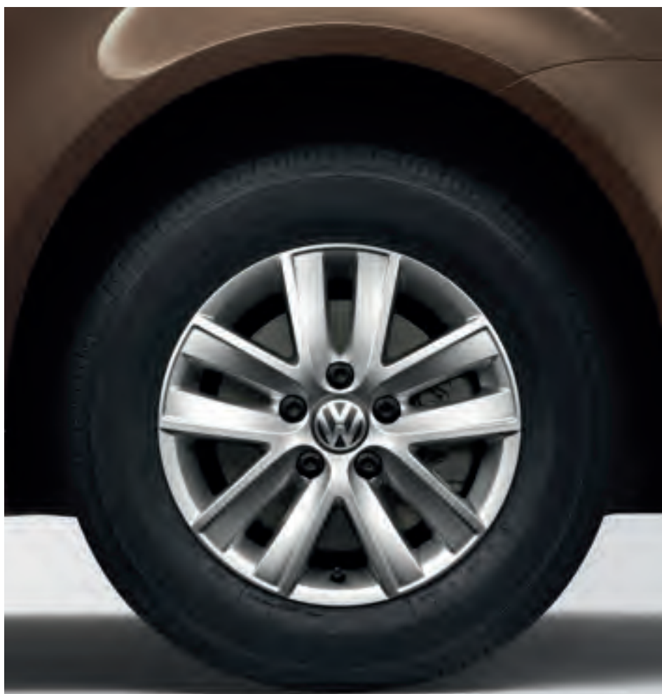
Чотири 6 J x 15 колеса "Кетора". З шинами розміром 195/65 R15.

Місткі та зручні всередині, спортивні ззовні. Чи віддаєте ви перевагу елегантному виду? Обирайте дизайн, який якнайкраще відповідає вашим смакам з цілого ряду різних розмірів коліс з дисками з легкого сплаву та надайте вашому Caddy особливого вигляду.