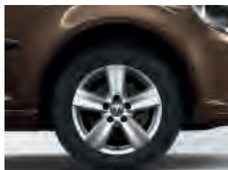
Чотири 6 J x 16 колеса "Siracusa". З шинами розміром 205/55 R16

Стандарт для Caddy Maxi Comfortline. Доступні для 7-місного Caddy Maxi Startline.