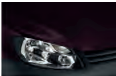
Black Berry 2) металік C0C0