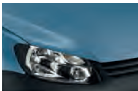
Beluga Blue 1) однотонна фарба D0D0