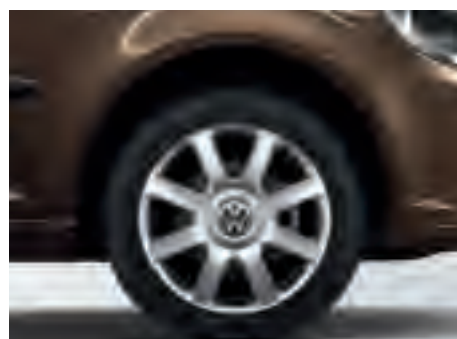
Чотири 6 J x 16 колеса "Zolder". З шинами розміром 205/50 R17.