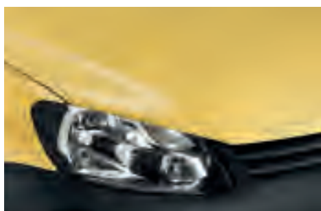
Sunny Yellow 1) однотонна фарба M9M9