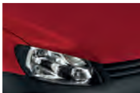
Salsa Red 1) однотонна фарба 4Y4Y