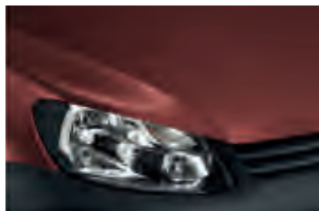
Lava Red 1), 2) металік F0F0