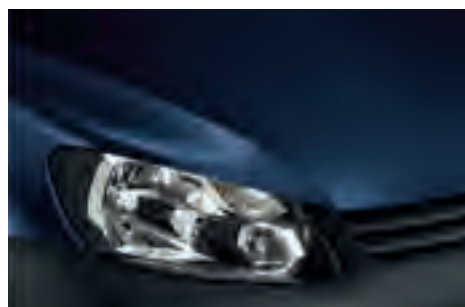
Night Blue 1), 2) металік Z2Z2