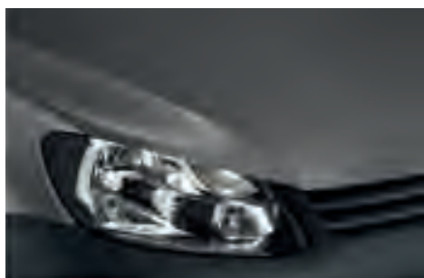
Natural Grey 2) металік M4M4