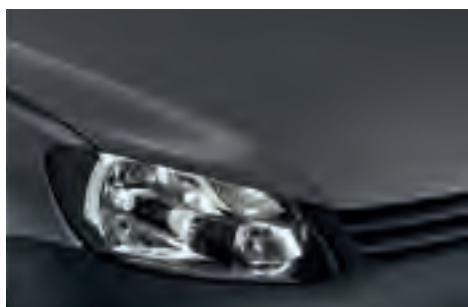
Pure Grey 1) однотонна фарба J2J2